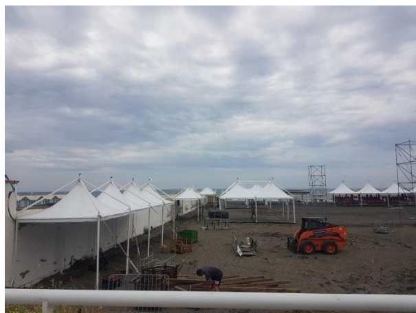
domenica 6 giugno (lato spiaggia)