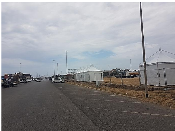
domenica 6 giugno (lato terra)

Centinaia di foto e filmati precedenti alla data dell'11 giugno dimostrano che già da fine maggio le aree erano state occupate dalla Club Italia ASD per il montaggio delle strutture, senza alcun cartello lavori, senza alcun controllo da parte degli Uffici e delle Autorità preposte. Se ne mostrano solo alcune esemplificative..