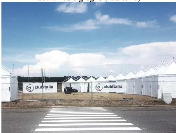
mercoledì 9 giugno (lato terra)