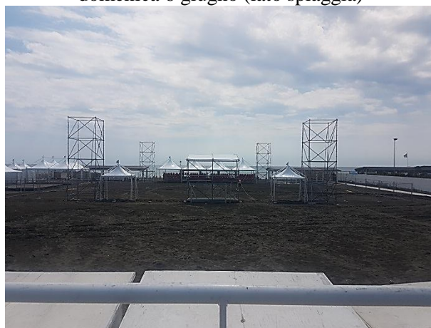
mercoledì 9 giugno (lato spiaggia)